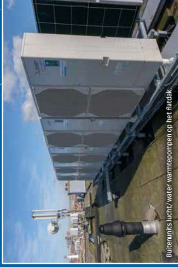
Buitenunits lucht/water warmtepompen op het flatdak.