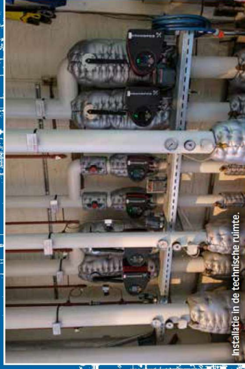
Installatie in de technische ruimte.